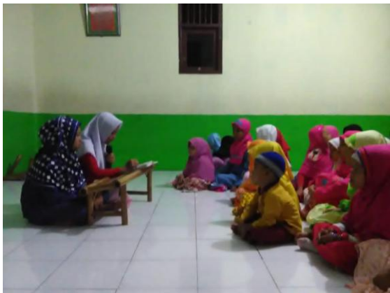
FOTO-FOTO KEGIATAN MAJLIS TA'LIM AL-IRSYAD KOTA TENGERANG